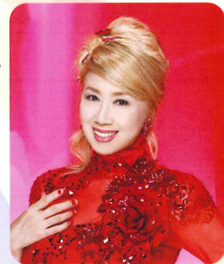
特別ゲスト 瀬川 瑛子